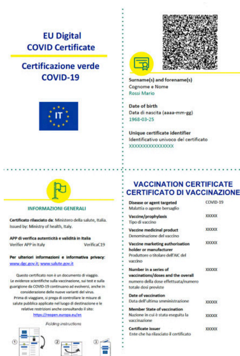
Fig. 2 - Esempio di Certificazione Verde Covid-19 contenente i dati della Certificazione Vaccinale: ATTENZIONE, piegare il certificato in modo che sia visibile solo il QR Code, NON le informazioni relative alla eventuale vaccinazione