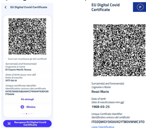
Fig. 1 – Esempi di QR Code da App Immuni o IO

La persona che intende accedere mostra all'addetto il QR Code del proprio Green Pass COVID-19 in formato digitale dal proprio dispositivo mobile oppure attraverso una stampa di buona qualità. Nel caso di esibizione di certificato di vaccinazione cartaceo dovrà essere mostrato all'addetto il solo QR Code, NON l'intera Certificazione Verde Covid-19 (EU Digital Covid Certificate)